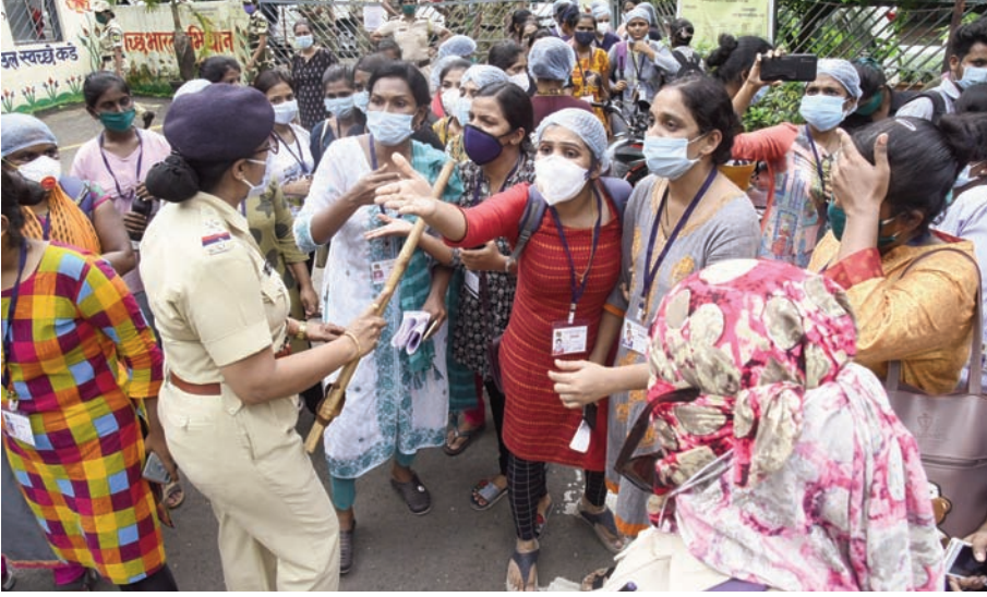
ठाणे ग्लोबल कोव्हीड रुग्णालयात काम करणाऱ्या परिचारिका व इतर कर्मचाऱ्यांना कोणतीही पूर्व कल्पना न देता कामावरून काढण्यात आल्याने संतप्त झालेल्या कर्मचाऱ्यांनी महापालिका मुख्यालयाला धडक देत आंदोलन केले.